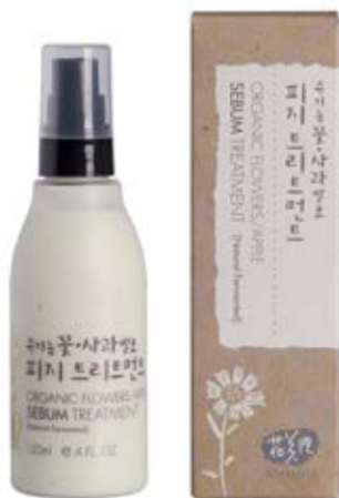
Fluid pro problematickou pleť