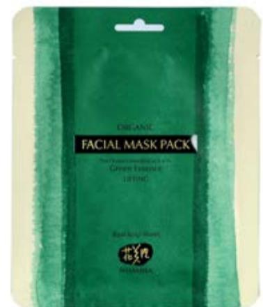
Maska z mořských řas Kelp