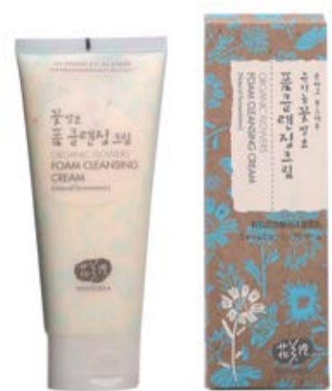
Pěnový čistící krém